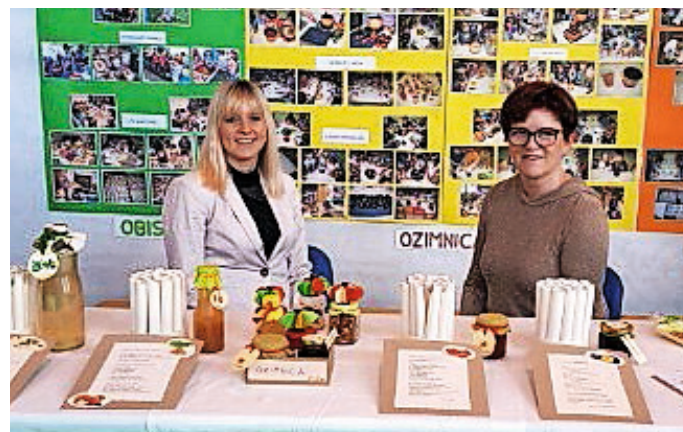
S predstavitve na Celjskem sejmu Altermed

Jeseni smo na obiskih v lokalnem okolju in pri kuharskih dejavnostih v naši igralnici spoznavali, da je najbolj zdravo uživanje svežih in presnih pridelkov. A teh je v izobilju le v jeseni, zato ostanek primerno shranimo ali predelamo v ozimnico. Skuhali smo paradižnikovo omako, slivovo marmelado, gosti sok iz jabolk in korenja ter sušili jabolčne krljice. Vse smo shranili v reciklirano embalažo. Pripravili smo male ozimnice, ki so jih otroci v zimskem času na različne načine porabili v domačem okolju. Iz melise in mete smo skuhalili zeliščni sirup, na delavnici peke na ekološki kmetiji Pr' Martinšk pa smo spekli medenjake. V prednovoletnem času smo strli orehe in zmleli jedrca, ki smo jih uporabili za nadev pri