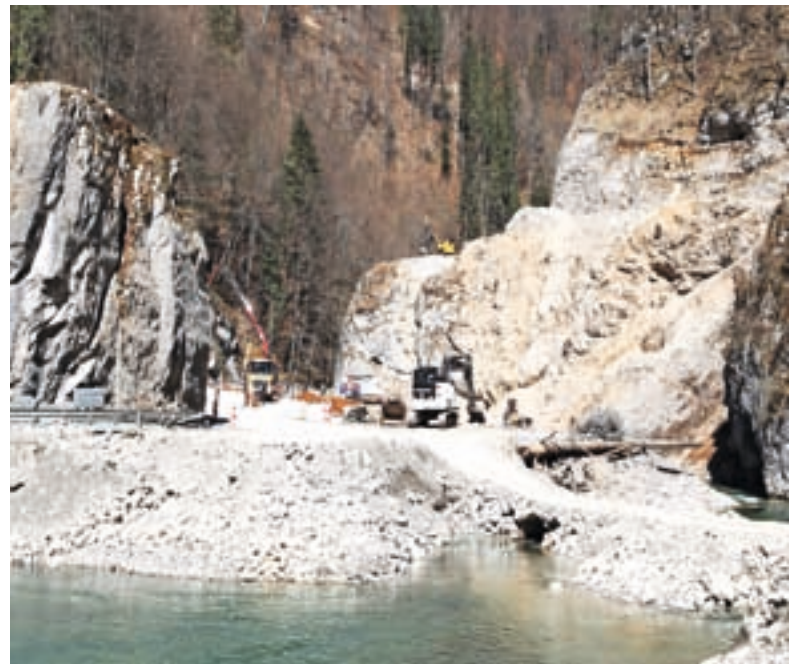
Gradnja na območju zadrževalnika pod Sušo

V zvezi s prvo fazo vodnih ureditev v Železnikih je župan povedal še, da je občina na drugem odseku Selške Sore od Domela proti Dermotovemu jezu ob gradnji kanalizacije izve-