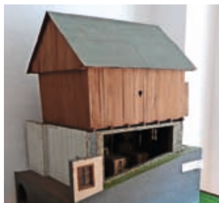
Maketa Mlinarjevega mlina na Češnjici v Muzeju Železniki

Mlinarstvo je bilo v Selški dolini še v sredini 20. stoletja zelo prisotno. Prevladovali so hišni mlini, nekaj je bilo tudi obrtnih. V muzejski zbirki z ma-