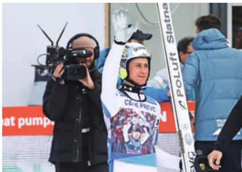
Cene Prevc je pomahal v slovo uspešni karieri.

Po tem, ko celo sezono ni skakal, je v soboto, 1. aprila, med serijama ekipne tekme s poslovnim skokom na letalnici bratov Gorišek potrdil, za kako velikega športnika gre. Skorajda brez treninga je pristal pri 218,5 metra. V izteku so ga pričakali najbližji in prijatelji in ga popeljali v tekmovalni skakalni pokoj. »Bilo je približno tako, kot sem si zaželel. Poslovil sem se v Planici, ki je v zadnjih letih postala kar moj dom. Zadnji polet sem želel izpeljati dostojno. Upal sem, da bo šlo dlje. Ne morem iz svoje kože, vedno želiš boljše, dlje, hitreje, sploh pri skokih čim dlje. Na zaletni rampi sem odklopil okolico in se povsem osredotočil na skok. Če se ne bi, verjetno ne bi šlo prav daleč. Hvala